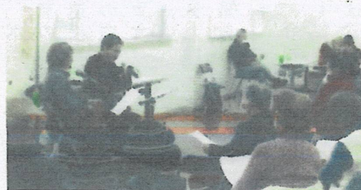
(昭和歌謡&フォークソング)

て頂けたと思います。次年度も地域の皆様に興味を持って頂き、多数の方々が楽しみにして頂けるよう実施時期、お知らせの仕方などの見直しをしていきます。