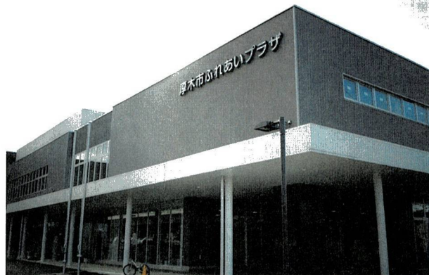
▲新しい「厚木市ふれあいプラザ」がオープン

具体的な施設としては、①温水プール(25m遊泳×6レーン・歩行者用×2レーン・流れるプール・ジャグジー・幼児用プール)②スタジオオ