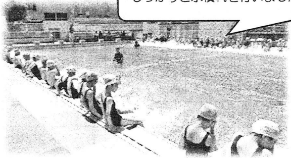
しっかりと水慣れを行いました。

7月に、全学年で「水泳学習」を実施しました。およそ3年ぶりの学校での水泳学習となりました。どの学年でもプールに入る前に、心構えやルールなどを確認し、安全に行いました。子どもたちはとても楽しそうに学習に取り組みました。