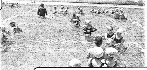
5,6年生では、着衣泳を行い、水の事故にあった時の対応についても学びました