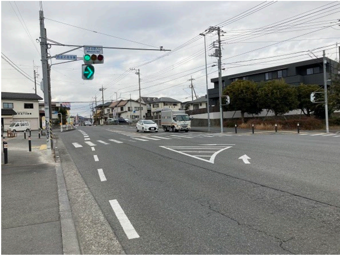
右折信号設置時の想像図